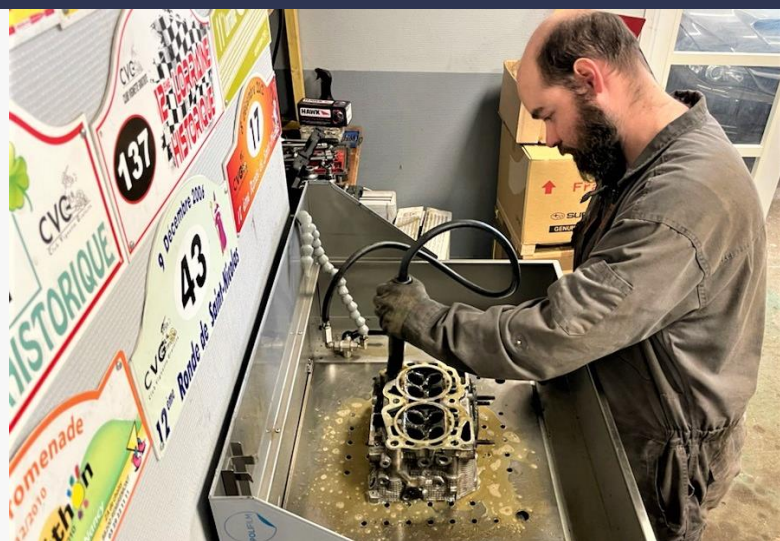
Utilisation d'une fontaine de dégraissage biologique acquise à la suite du projet pour limiter l'impact sur la santé des opérations de dégraissage

« J'ai testé le nettoyant dégraissant universel écologique d'Abnet en tant que dégraissant frein. Au-delà du test en lui-même, la participation à ce projet m'a amené à réfléchir sur mes pratiques et les produits que j'utilise fréquemment , en termes d'impact sur la santé et sur l'environnement. Chose que je ne prends pas le temps de faire au quotidien. La démarche est concrète et je suis prêt à tester de nouveaux produits avec le CNIDEP et la CMA ! »